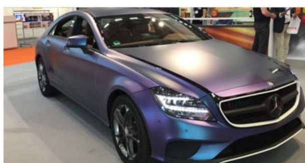
Material utilizado: KPMF K75566 Matt Purple Blue Iridescent

Consulte la disponibilidad y precios de estos films.