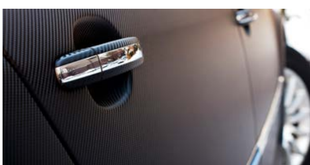
Material utilizado: KPMF K87021 Black Gloss Carbon Fibre VWS V